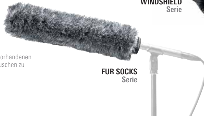
FUR SOCKS Serie

Überziehfellwindschutzsysteme passen über einen bereits vorhandenen Windschutz aus Schaumstoff, um den Schutz vor Windgeräuschen zu erhöhen.