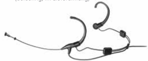
Abb. mit Nackenbügel AT8464 (beidohrig; im Lieferumfang)

Auch geeignet für Funksysteme von Audio-Technica und anderen Herstellern.